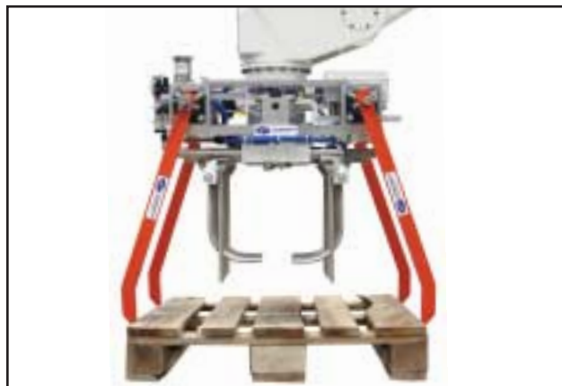
Bras préhenseurs de palettes au travail

l'équipement avec différents modules optionnels.