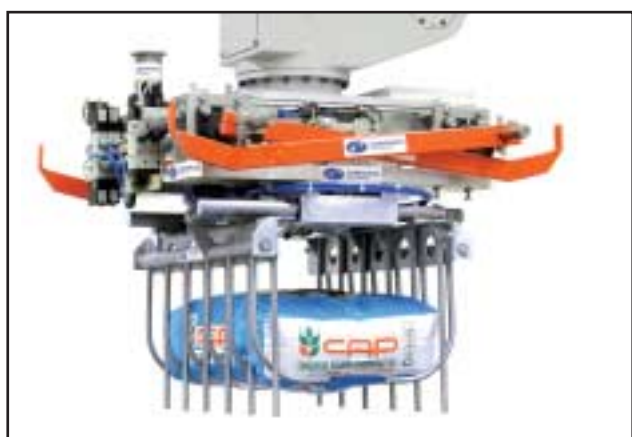
Pince avec système préhenseur de palettes